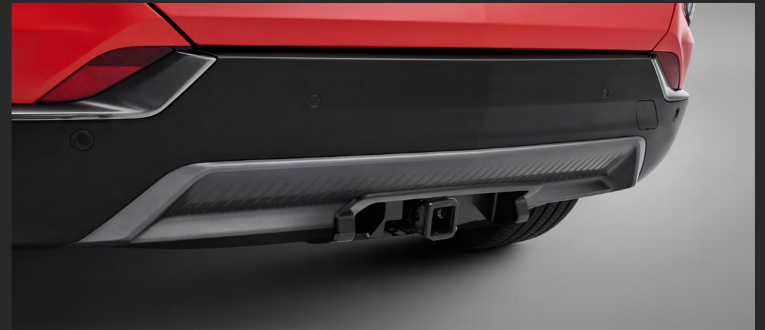
CUBIERTA EMBELLECEDORA PARA ENGANCHE DE REMOLQUE