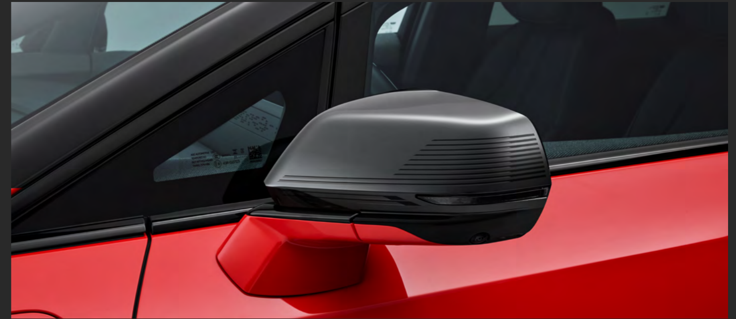
CUBIERTA DE ESPEJO