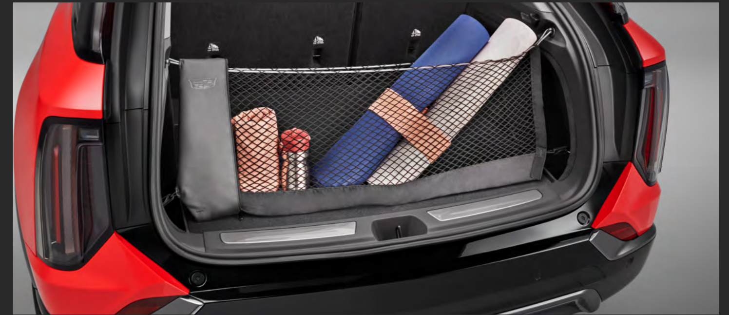
RED DE CAJUELA VERTICAL