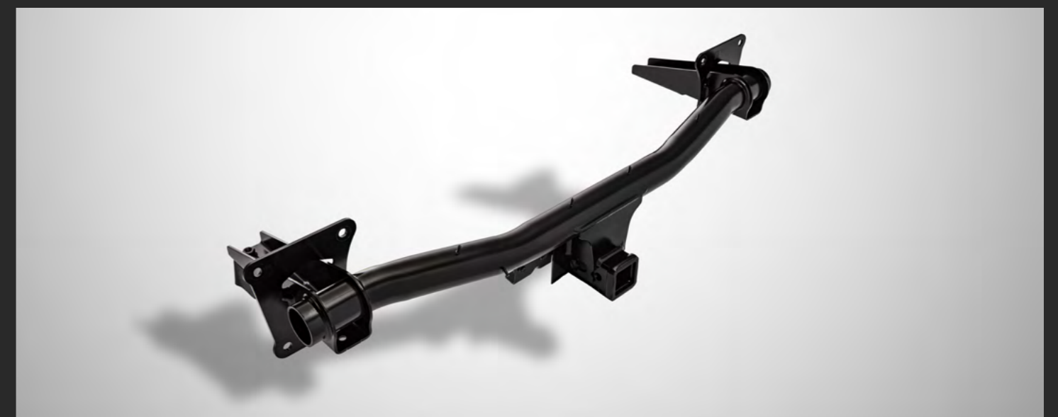
ENGANCHE DE REMOLQUE