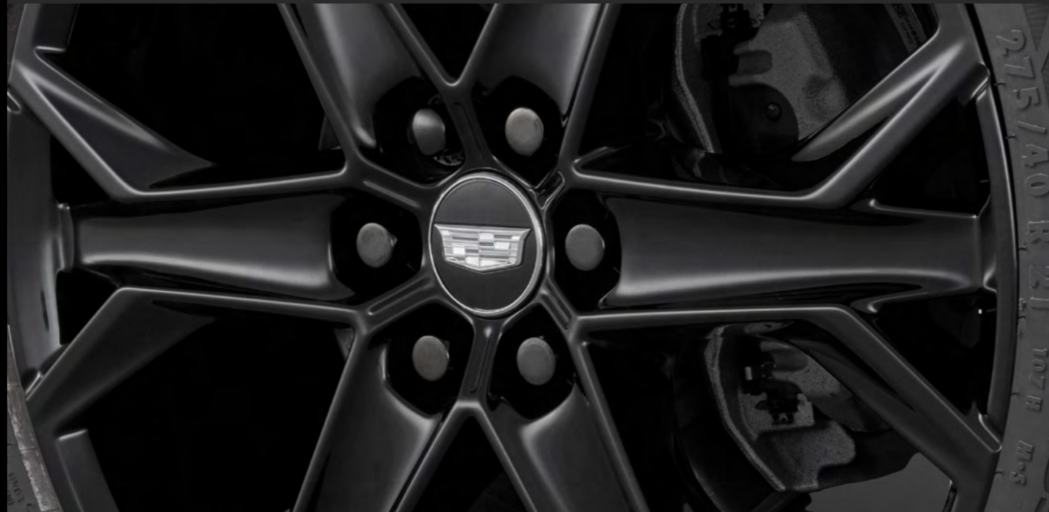
BIRLOS DE SEGURIDAD EN NEGRO