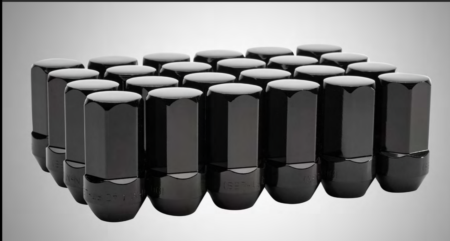
PAQUETE DE BIRLOS EN NEGRO (24 PIEZAS)