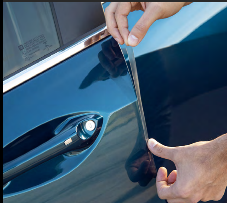
CINTA DE PROTECCIÓN DE PINTURA PARA FILOS DE PUERTA