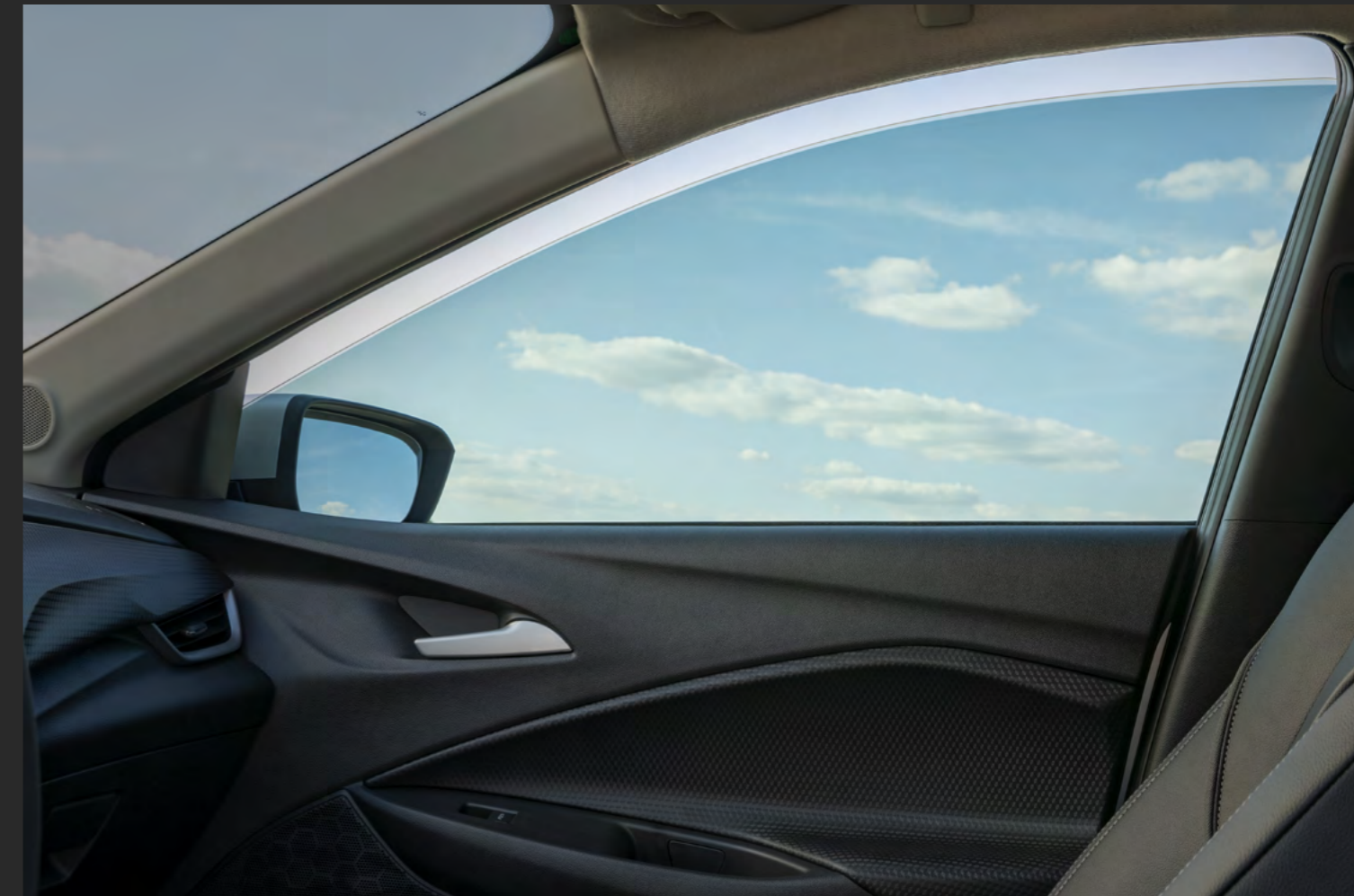
PELÍCULA DE SEGURIDAD TRANSPARENTE Y CONTROL SOLAR