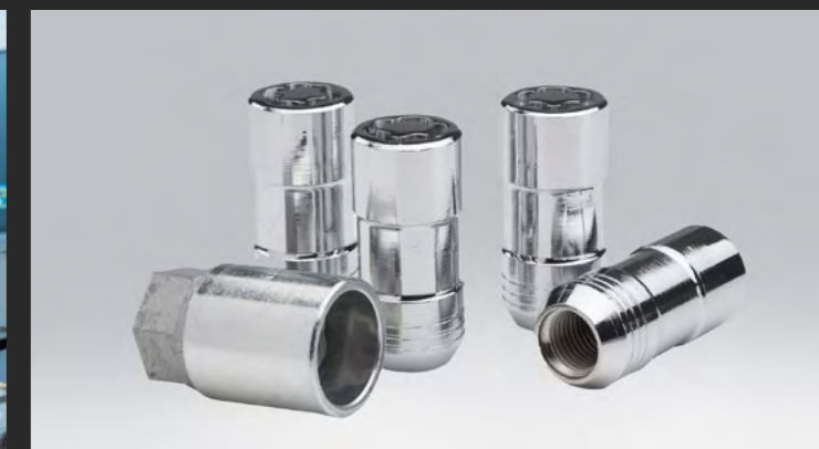
BIRLOS DE SEGURIDAD EN CROMO