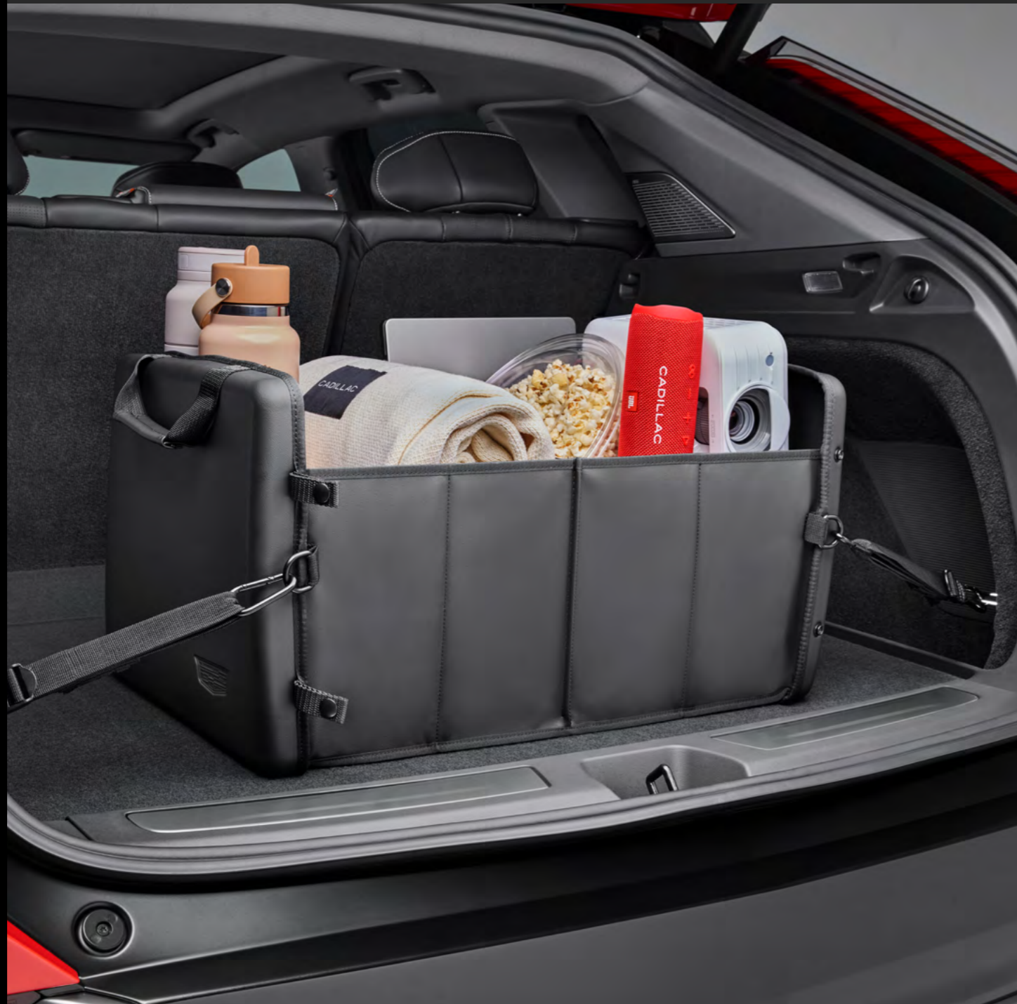
ORGANIZADOR DE CAJUELA EN NEGRO CON LOGO CADILLAC