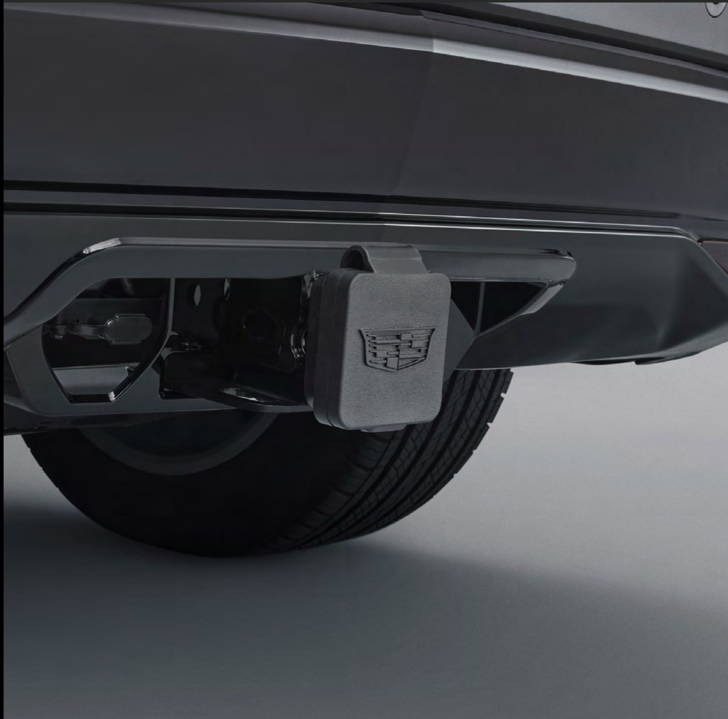
TAPA PARA ENGANCHE DE REMOLQUE