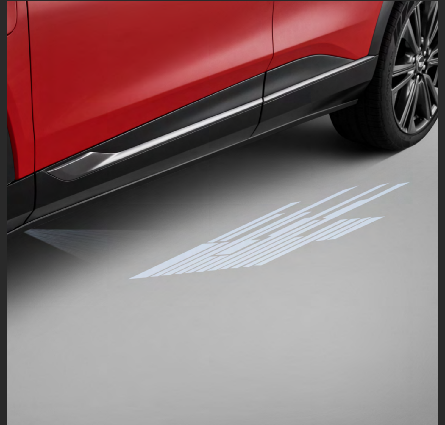
PROYECTOR DE LOGO CADILLAC