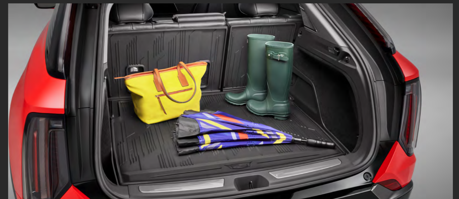
TAPETE DE VINIL RIGIDO PARA CAJUELA DE COBERTURA EXTENDIDA