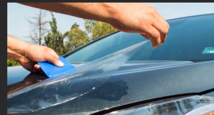
ROLLO DE PELÍCULA DE PROTECCIÓN DE PINTURA