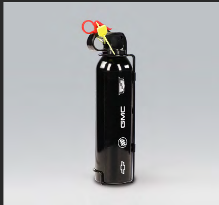
EXTINTOR (4 PIEZAS)